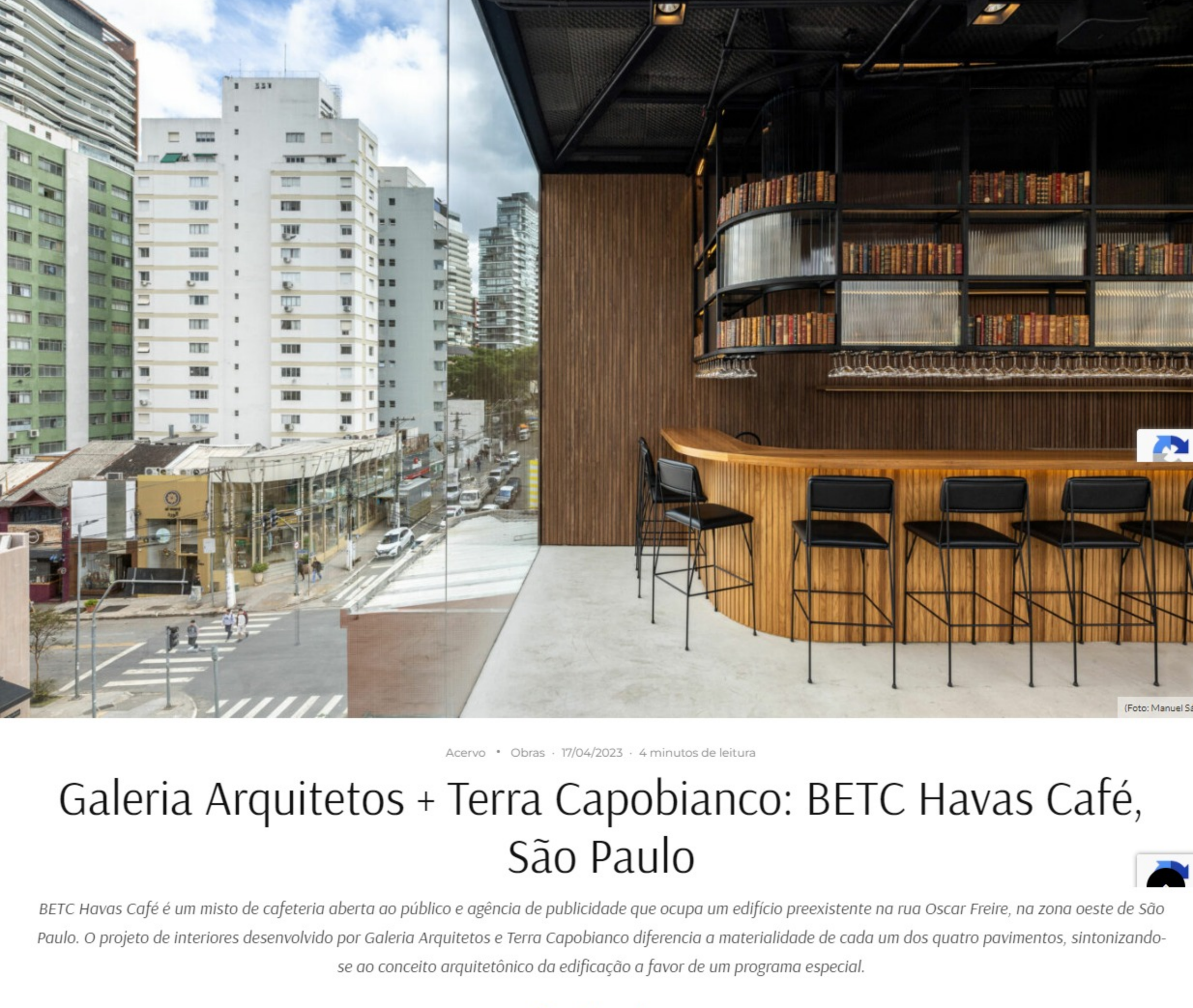
Acervo • Obras • 17/04/2023 • 4 minutos de leitura