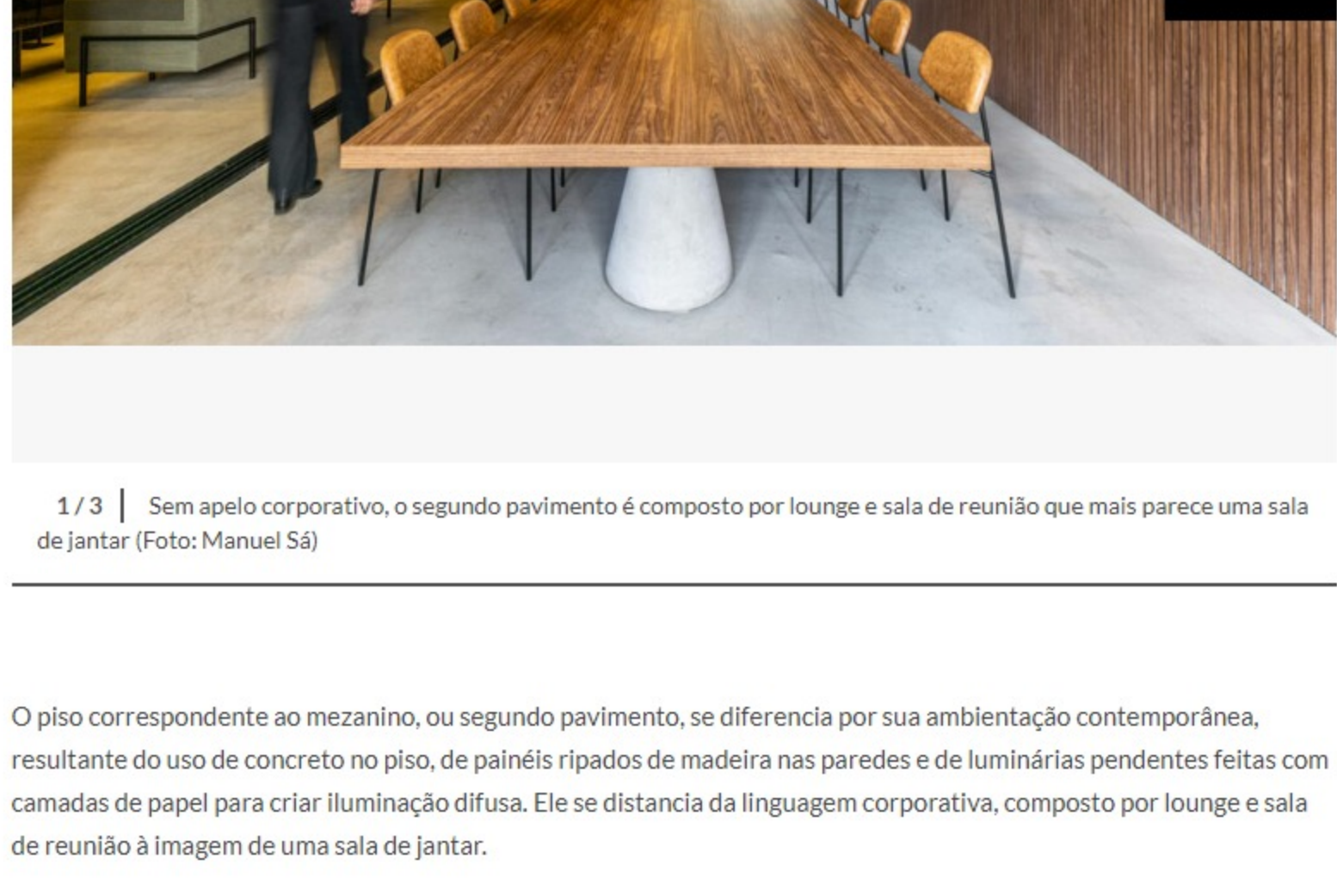
1 / 3 | Sem apelo corporativo, o segundo pavimento é composto por lounge e sala de reunião que mais parece uma sala de jantar

O primeiro pavimento é o de maior densidade de ocupação, concentrando parte da área de atendimento da cafeteria e os espaços de trabalho da equipe da agência. Prevalecem os acabamentos de aço e concreto, conferindo perfil mais industrial ao pavimento com a maior presença de elementos preexistentes – como o teto com instalações aparentes e o núcleo de madeira da escada de emergência, que foi mantido com nova pintura na cor preta.