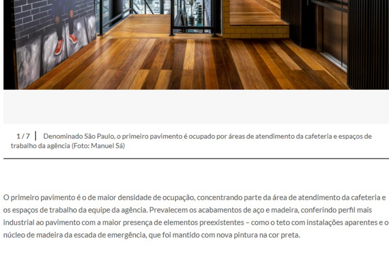
1 / 7 | Denominado São Paulo, o primeiro pavimento é ocupado por áreas de atendimento da cafeteria e espaços de trabalho da agência

Em sintonia com a arquitetura do edifício, o projeto tem áreas ambientadas com diferentes materialidades, cada qual com sua linguagem de modo a evitar uma composição repetitiva. “O cliente foi muito aberto em relação a estilo, revestimentos e materiais”, narra Ana. Bar e estofados assinados por designers brasileiros são os únicos pontos comuns a todos os andares. Dedicado a cafeteria, bar e cozinha, além da livraria na parte posterior da implantação, o piso térreo se caracteriza pela transparência na escada e pelo embaçamento das paredes laterais, somado ao piso de pedra e à madeira usada no forro e nas estantes. “Essa combinação oferece mais aconchego aos espaços”, diz Ana.