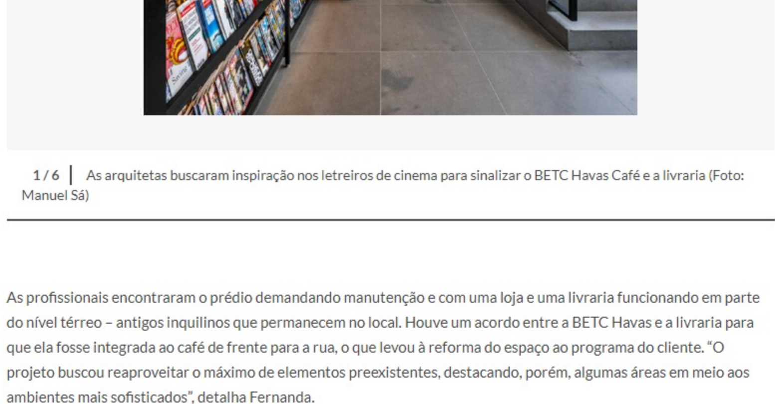
1 / 6 | As arquitetas buscam inspiração nos letreiros de cinema para sinalizar o BETC Havas Café e a livraria