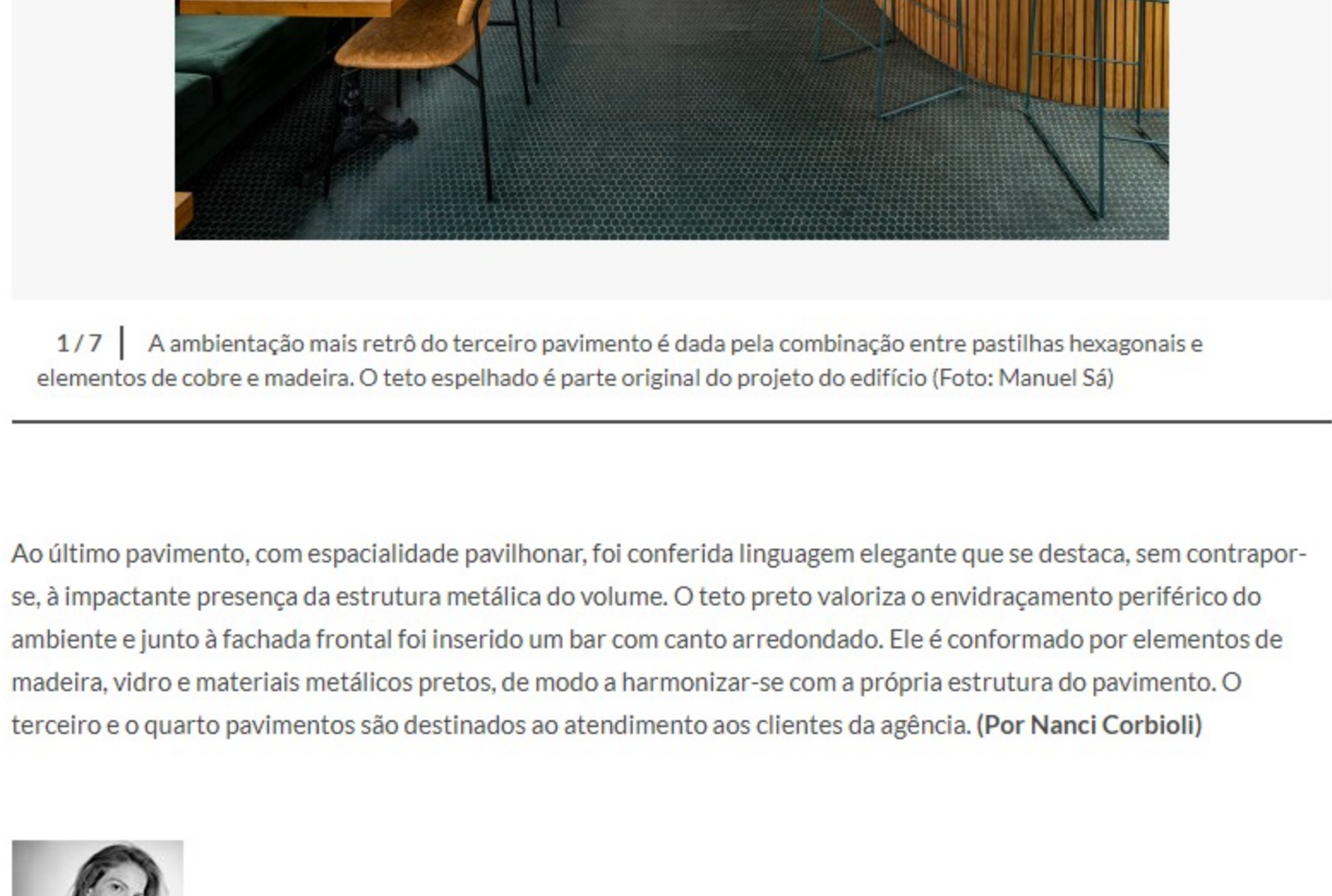
1 / 7 | A ambientação mais retrô do terceiro pavimento é dada pela combinação entre pastilhas hexagonais e elementos de cobre e madeira. O teto espelhado é parte original do projeto do edifício

Já o terceiro pavimento tem ambientação mais sofisticada, com a presença de faces de vidro transparente que abrem vistas para a cidade, e de pastilhas hexagonais no piso que contrastam com elementos de cobre e madeira. Destaque no espaço, o teto espelhado é um elemento original do projeto que, entre outros, destaca o quarto pavimento, apoiado de forma assimétrica e percebido como um volume suspenso idealizado como um mirante para a cidade.