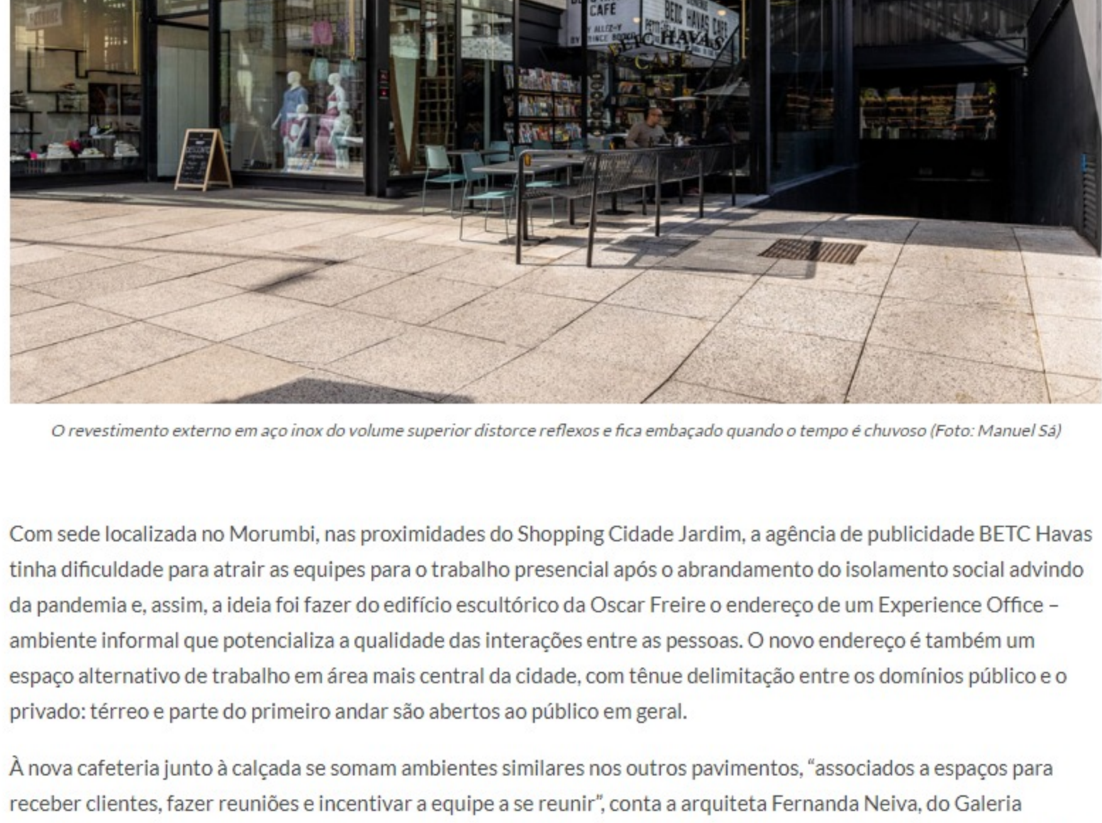
O revestimento externo em aço inox do volume superior distorce reflexos e fica embaçado quando o tempo é chuvoso

Com sede localizada no Morumbi, nas proximidades do Shopping Cidade Jardim, a agência de publicidade BETC Havas tinha dificuldade para atrair as equipes para o trabalho presencial após o abrandamento do isolamento social advindo da pandemia e, assim, a ideia foi fazer do edifício esculptórico da Oscar Freire o endereço de um Experience Office – ambiente informal que potencializa a qualidade das interações entre as pessoas. O novo endereço é também um espaço alternativo de trabalho em área mais central da cidade, com tênue delimitação entre os domínios público e o privado: térreo e parte do primeiro andar são abertos ao público em geral.